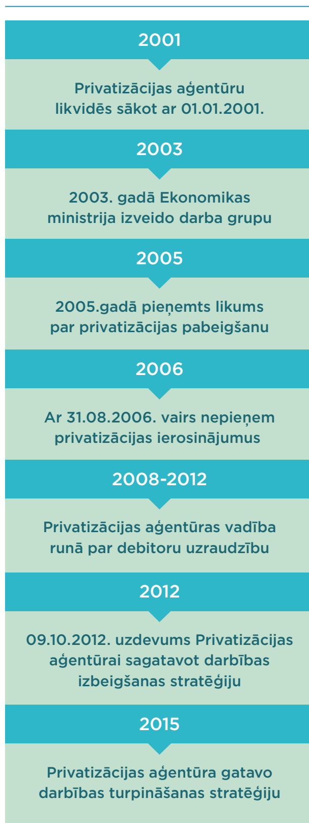
Attēls nr. 6. Apkopojums par Privatizācijas aģentūras gada pārskatos iekļauto informāciju.

2015. gada beigās Ekonomikas ministrija atgriezās pie domas par Privatizācijas aģentūras darbības turpināšanu, pamatojot to ar likumā noteikto, ka Privatizācijas aģentūra turpinās pildīt Publiskas personas kapitāla daļu un kapitālsabiedrību pārvaldības likumā paredzētās valsts kapitāla daļu atsavināšanu veicošās institūcijas uzdevumus, līdz brīdim, kad Ministru kabinets pieņems lēmumu par valsts kapitāla daļu atsavināšanu veicošo institūciju un Privatizācijas aģentūra būs nodevusi tās turējumā esošās kapitāla daļas.